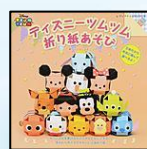
『ディズニーツムツム折り紙あそび』

えいこうさく にがて ひと 絵や工作が苦手な人でもだいじょうぶ。楽しんでるうちに、思いがけず、すてきな作品ができあがるかも。紙とスチレンペーパーを使った切り紙・スタンプ・はんがのきほん、それらのぎほうをつかって、モビールやカード、スタンプなどをつくる方法をしょうかいします。型紙つき。