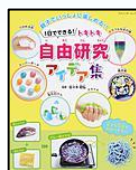
『1日できる！ドキドキ自由研究アイデア集』

はこの形や、さいころの形のように、いくつかの面でかこまれた立体を「多面体」といいます。立体の形がよくわかるよう、ストローとモールをつかって、楽しみながらいろいろな多面体をつくってみましょう。正多面体からデルタ多面体まで、30種類以上の多面体の作り方をしょうかいします。