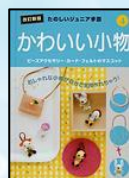
『たのしいジュニア手芸 4』

いろいろなビーズの種類やそろえておきたい道具、テグスとワイヤーのきほん的なあみかたのしょうかいの後、指わやかみどめ、ブローチなどの作り方が、図を使ってわかりやすく書いてあります。金具のとりつけ方も出ていますので、いろいろなアクセサリーも作れます。むずかしいところは、大人の人に手伝ってもらって、さあ作ってみましょう。