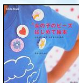
『女の子のビーズはじめて絵本』

いろいろなビーズの種類やそろえておきたい道具、テグスとワイヤーのきほん的なあみかたのしょうかいの後、指わやかみどめ、ブローチなどの作り方が、図を使ってわかりやすく書いてあります。金具のとりつけ方も出ていますので、いろいろなアクセサリーも作れます。むずかしいところは、大人の人に手伝ってもらって、さあ作ってみましょう。