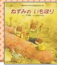
『ねずみのいもほり』 やました はるお 山下 明生／作 いわむら かずお／絵

なかよしの友だちと、大げんか。公 園の落ち葉に寝ころんで、いろん なことを考えて、家に帰ってみた ら、おじいちゃんがたき火をしてい ます。「じいちゃんのやきいもはう まいぞー！」けんか相手の女の子 もそこにいて…？