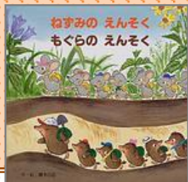
『ねずみのえんそく もぐらのえんそく』 ふじもと しろう／作・絵 藤本 四郎／作・絵

かわいいこうもりのモリくと、 おいもカーでドライブしよう！ おいもカーは、走って・ゆで て・つぶして・焼いて・おやつ に大変身！実りの季節にぴっ たりな、モリくんの愉快でおい しい冒険絵本。