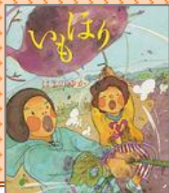
『いもほり』 はまの ゆか／作

きょうはとってもいい天気。おいし いものをとりに行こう！ねずみ園 のみんなは、いもほり遠足へしゅっ ぱ一つ！もぐら園のみんなも、いも ほり遠足へしゅっぱ一つ！いっば いおいも、ほれるかな。