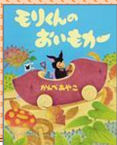
『モリくんのおいもカー』 かんべ あやこ／作

かわいいこうもりのモリくと、 おいもカーでドライブしよう！ おいもカーは、走って・ゆで て・つぶして・焼いて・おやつ に大変身！実りの季節にぴっ たりな、モリくんの愉快でおい しい冒険絵本。