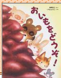
『おいもをどうぞ！』 しばの たみぞう 柴野 民三／原作 いもと ようこ／文・絵

森のみんなはやきいもが大好 き。おなかいっぱい食べたあ とは、おなら大会のはじまりで す。かわいいおなら、元気な おなら、おどりたくなるおなら …。いちばんいいおなら、した のはだあれ？