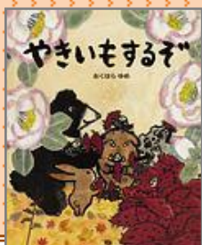
『やきいもするぞ』 おくはら ゆめ／作

秋はやきいも、いもほり行こう。 3匹のふたがいもほりへ。いも いもほりほりいもほりほり。いも をきずつけないように、やさしく ほろう。どんなかたちのいもがと れたかな？いもほりの豊かな楽 しみを描きます。