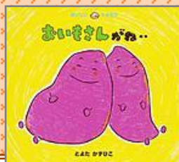
『おいもさんがね…』 とよた かずひこ／さく・え

くまさんの畑でおいもがどっさ りとれました。くまさんは考え ました。「ひとりで食べてはも ったいない。おとなりさんにも わけてあげよう。」思いやりを 育てるほのぼのしたお話。